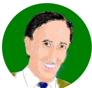
Ivan Illich, Le chômage créateur